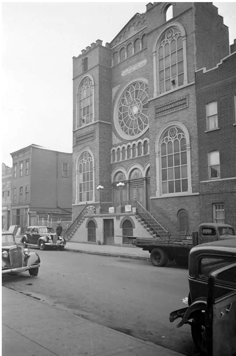
בית הכנסת „אגודת אחים אנשי ליובאוויטש“, 195 וואַטקינס סטריט